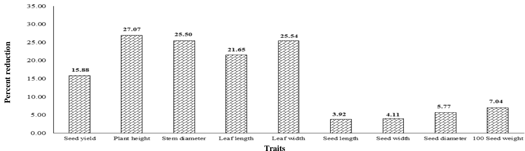
Figure 1. Percent of reduction in traits amount in drought stress conditions compared to normal conditions in sunflower genotypes.

*, ** and ns: Significant at 5 percent, 1 percent and non-significant.