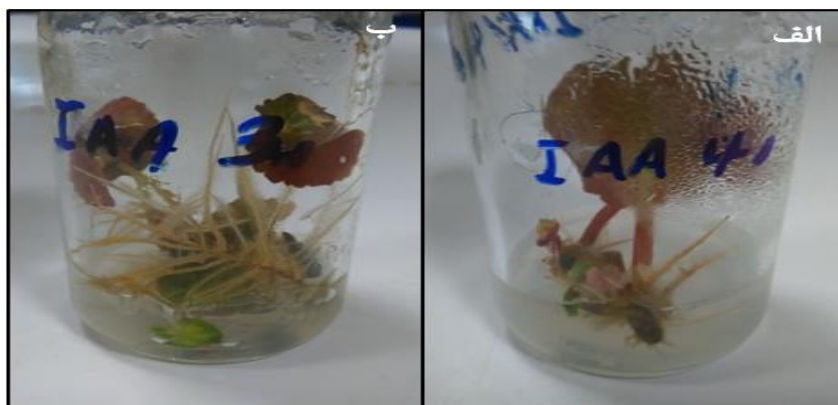
Figure 2. Rooting of B. elatior in IAA, right: 40 g/l Sucrose, left: 30 g/l Sucrose