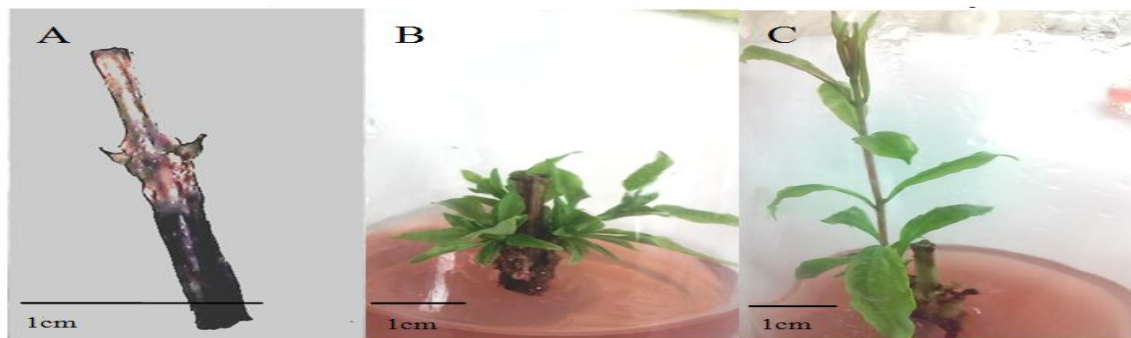
Figure 2. (A) Browning in pomegranate node explants cultured. The effect of BA concentration on shoots produced, (B) 2mg/L BA and 0/2 mg/L IAA and (C) 1mg/L BA and 0/2 mg/L NAA

کلات کننده EDDHA نسبت به EDTA توانایی بیشتری برای جذب مس از محیط کشت داشته باشد.