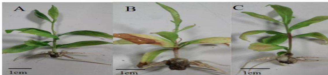
Figure 3. Rooting of pomegranate, (A) rooting with 1 mg/l IAA, (B) rooting with 1 mg/l NAA and callus induction and (C) rooting with 1 mg/l IBA and also callus induction

Means within a column followed by the same letters are not significantly different at \alpha = 0.05 .