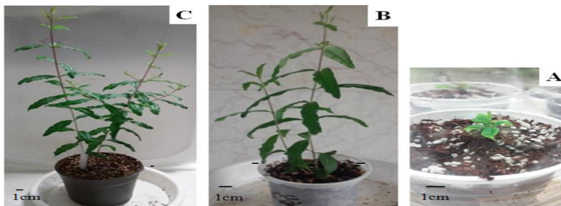
Figure 4. Hardening stage in the pomegranate plantlets: Pomegranate plantlet transferd from the culture medium to pot under plastic glass (A), one month (B) and 45 days after plantlet transferring (C)

Means within a column followed by the same letters are not significantly different at \alpha = 0.05 .